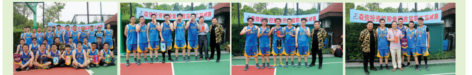
篮球比赛的人员合影